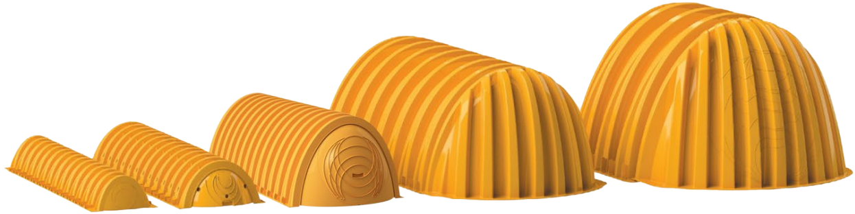
SC-160LP (85.4" x 25" x 12")