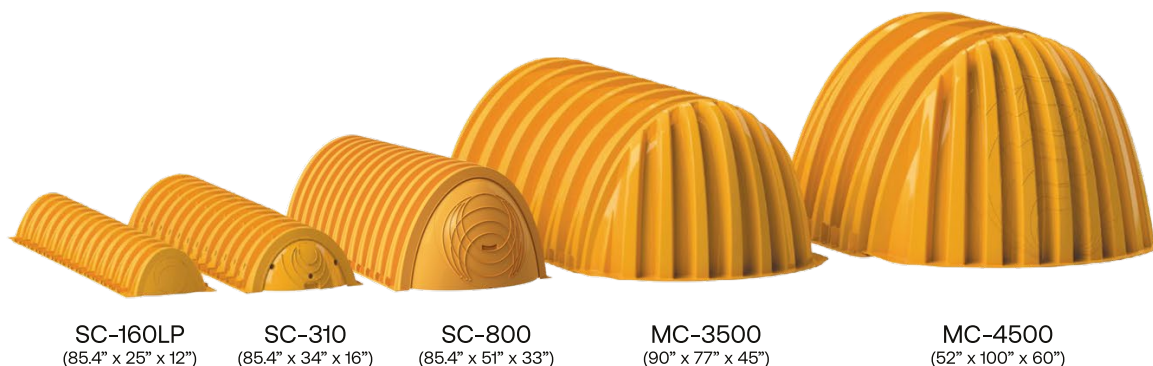
SC-160LP (85.4" x 25" x 12")

*Utilice la longitud instalada cuando conecte más de una cámara en una fila